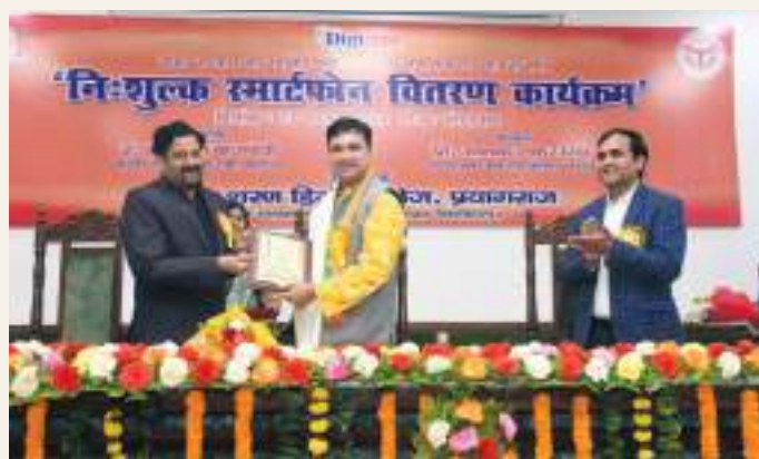
The distribution of free smartphones by the College