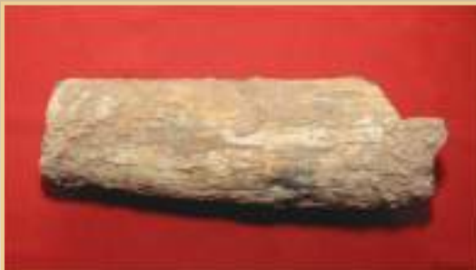
Prehistoric Elephant Tusk, Belan Valley