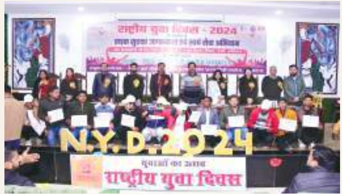
National youth day by NSS