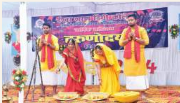
A Play by the students of the Cultural Committee