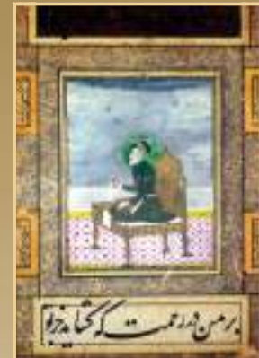
Painting of Bahadur Shah Zafar Translation - "who will open the doors of mercy for me without or expect you"