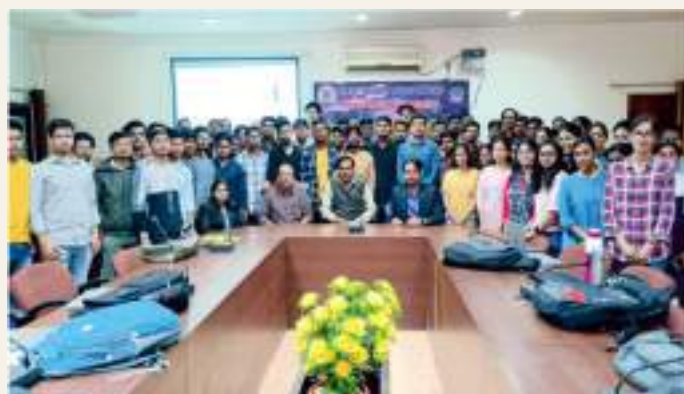
A special Lecture on Application of Artificial Intelligence