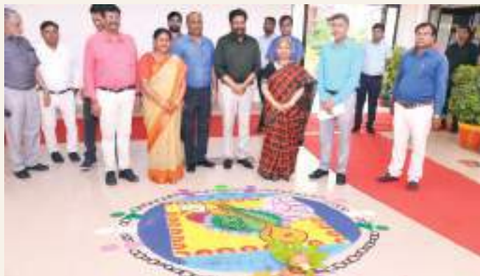
The Rangoli by the students of Cultural Committee