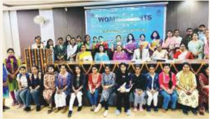
A programme on Women's Rights organised by The Women Cell.