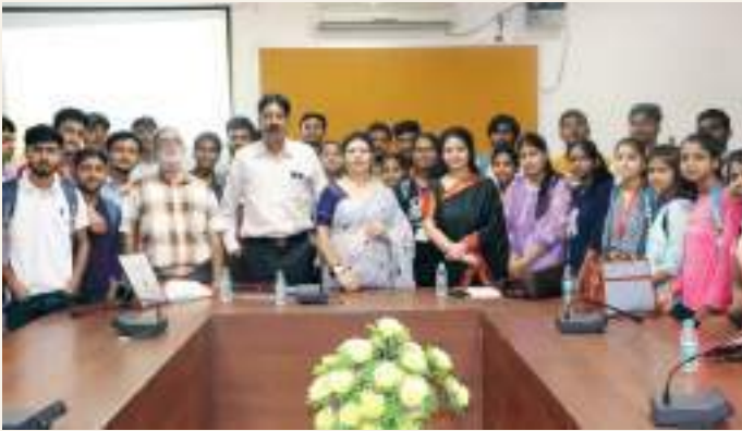
Philosopher's Day organised by the Department of Philosophy