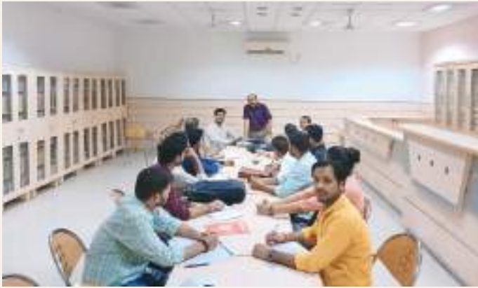
A Summer Workshop on Research Design by the Department of Political Science