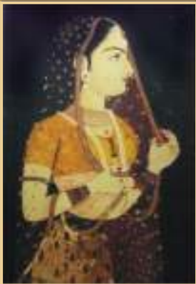
Mughal Portrait Art