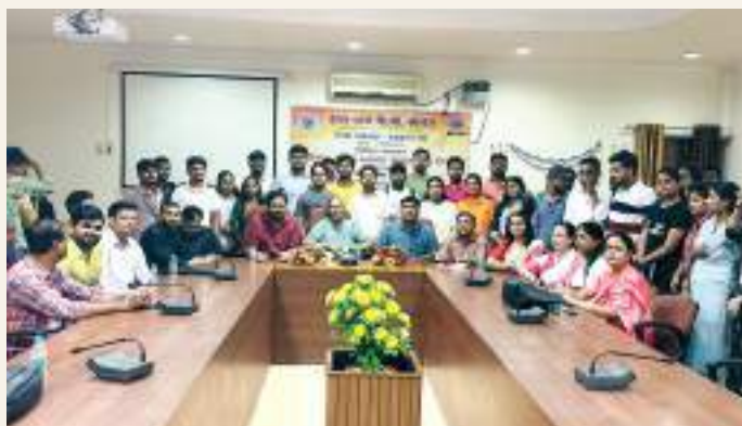
A special lecture during Hindi Pakhwara