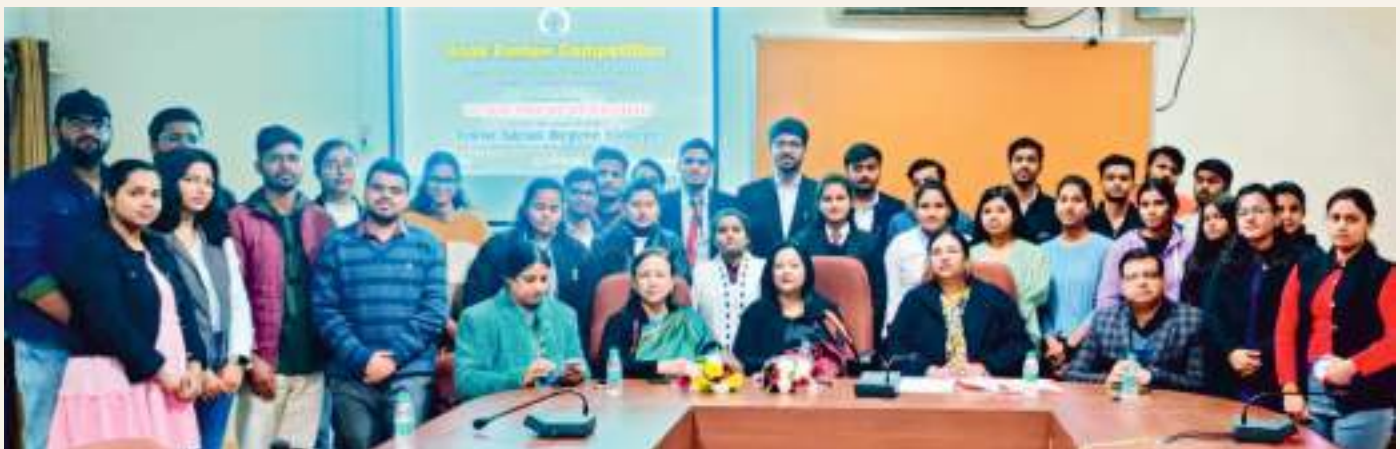
A Book review competition by the Department of English