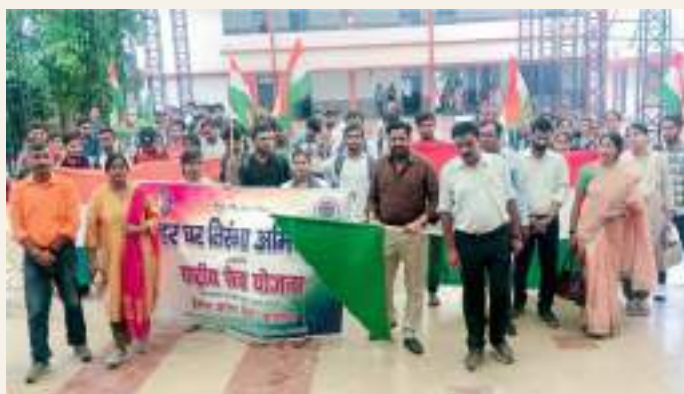
The Har Ghar Tiranga Campaign