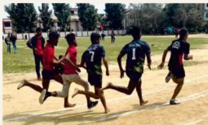
The Students participating in sports competitions