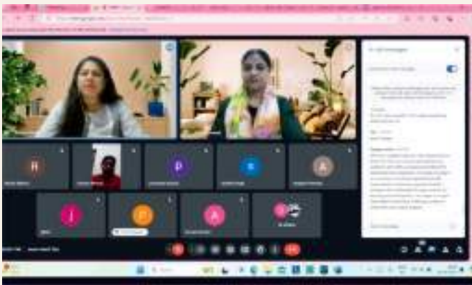
A capacity building workshop by the Training and placement cell