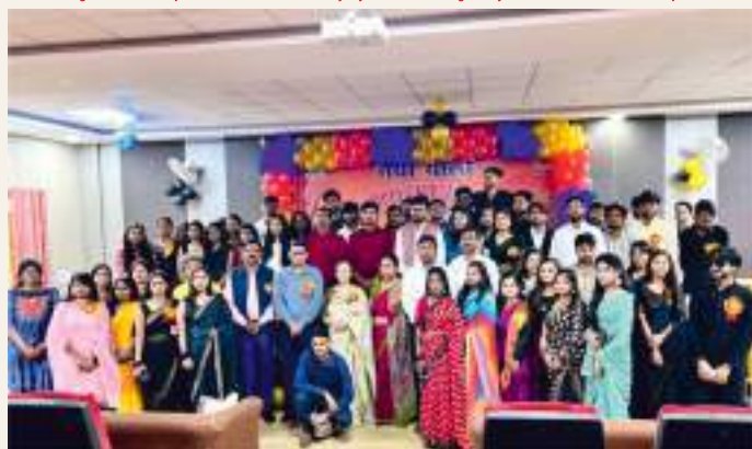
Farewell program by the Department of Sociology