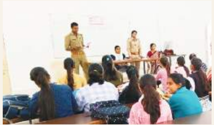
An Awareness Programme on Mission Shakti-Nari Suraksha, Nari Swavlamban