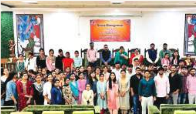
A workshop on Stress Management organized by the department of Sociology