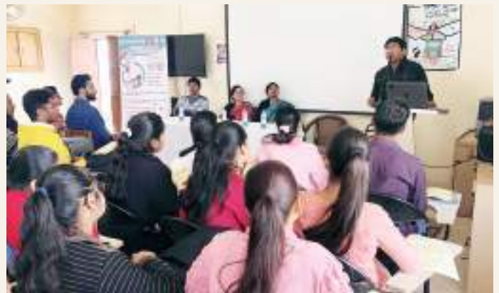
A workshop on Stress Management organized by the Department of Psychology