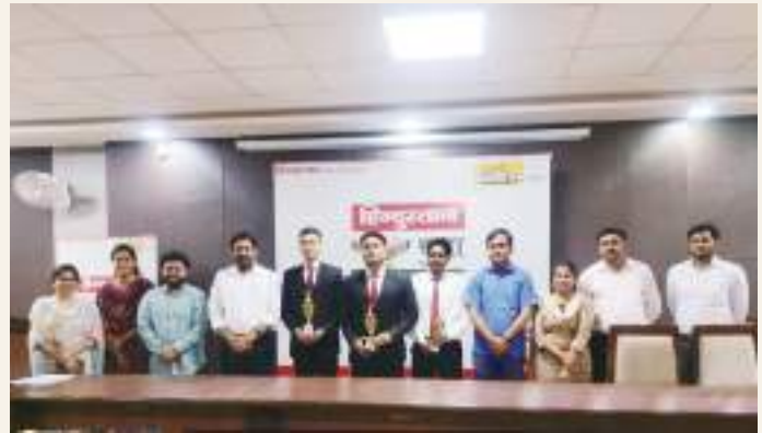
A Debate competition organised by the Centre of Legal Education