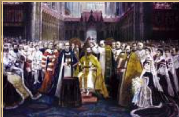
The Coronation of His Majesty King George V & Queen Mary (The Ceremony in West Minister Abbey-June 1911)