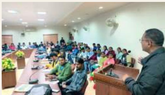
A special Lecture on Career Opportunities in Political Consultancy Domain