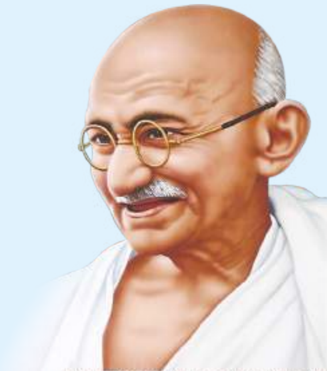
Mahatma Gandhi "Bapu"