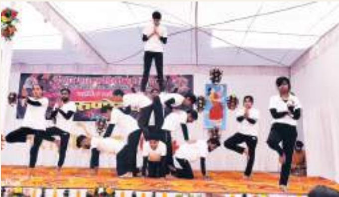
The Annual festival 'Tarunoday' organised by the Cultural Committee