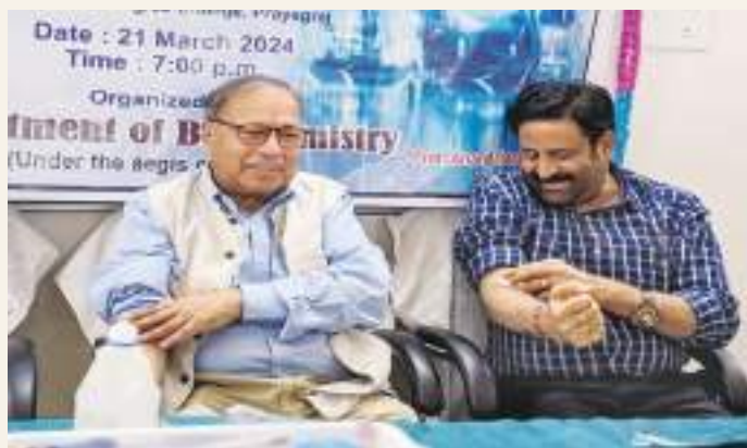
The inauguration of Department of Biochemistry by the Governing Body Chairman and the Principal of the College.