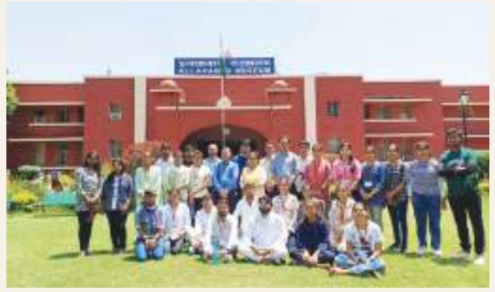
A Visit to Allahabad Museum on the occasion of World Heritage Day