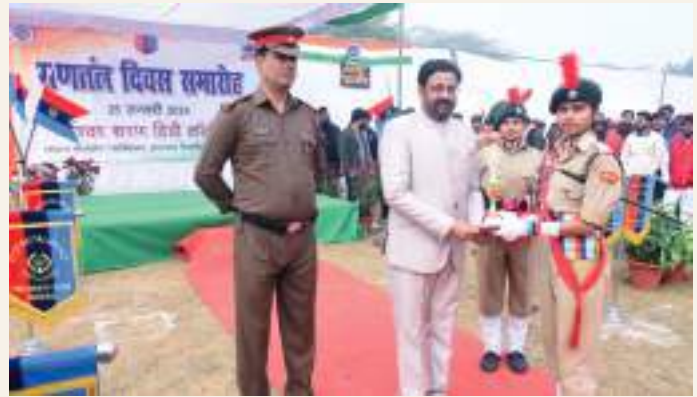
The student receiving a medal in the Republic Day Parade