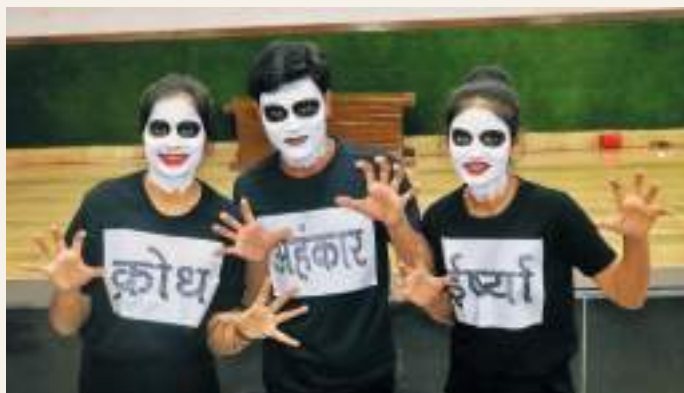
The Celebration of Gandhi Mah