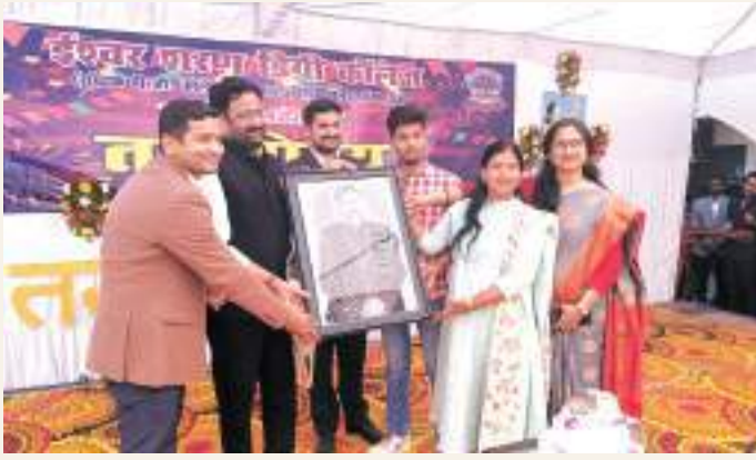
The Annual festival Trunodaya organised by the Cultural Committee