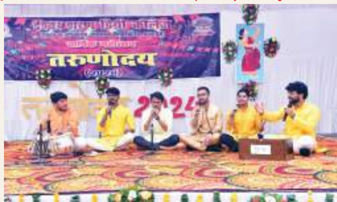
The Annual festival of the College