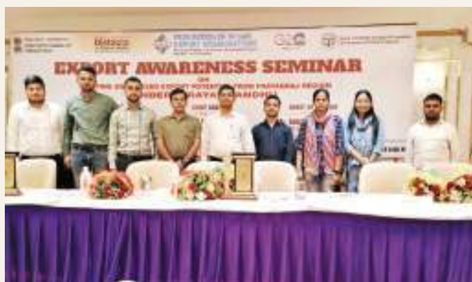
The Research scholars from the Economics and Commerce Department were participants in the Export Awareness Seminar