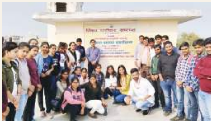
A visit to Government Manuscript Library on the occasion of World Heritage Week