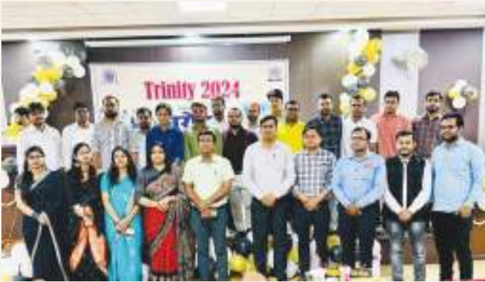
A Farewell organised by the department of Medieval History